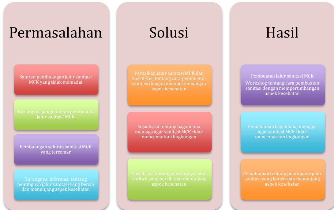
Gambar 1. Tahapan Pelaksanaan Program PKM