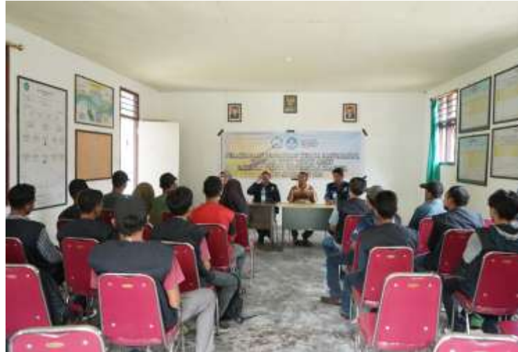
Gambar 3. Sambutan dan perkenalan pelaksanaan PKM Kelurahan Takofi

Setelah beberapa sambutan dan perkenalan, kegiatan selanjutnya Pembuatan dan Perbaikan Jalur Sanitasi Pembuangan MCK yang dilakukan secara langsung dilapangan bersama dengan beberapa penduduk Desa Takofi serta para mahasiswa yang ikut dalam kegiatan PKM