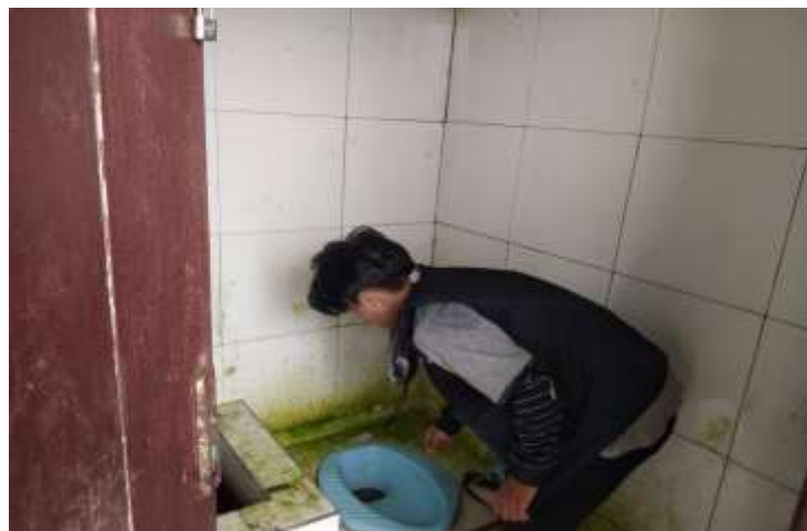
Gambar 4. Pembersihan Kamar Mandi/WC

20 peserta hadir dalam kegiatan PKM di Kelurahan Takofi yang terdiri dari bapak-bapak, ibu-ibu dan para generasi muda di desa tersebut. Selain peserta yang hadir pada saat sambutan para peserta lain yang terdiri dari para generasi muda dan bapak bapak nelayan juga hadir secara langsung dilokasi.