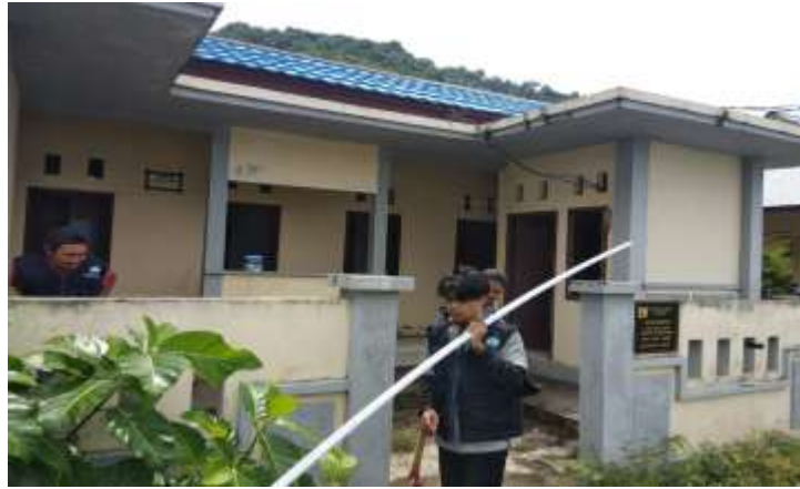
Gambar 5. Pengukuran dan Pemasangan Pipa Instalasi

Tahapan awal perbaikan dan pembuatan jalur sanitasi MCK adalah pembersihan MCK yang terlihat sangat kotor dan sudah tidak berfungsi dengan baik. Setelah pembersihan tahapan selanjutnya adalah pengukuran dan pemasangan pipa instalasi baru dimana jaringan yang lama sudah tidak berfungsi dengan baik. Pemasangan pipa ini juga berkaitan dengan program PKM lain yaitu perbaikan sumur air sebagai sumber air yang akan digunakan menjalankan MCK ini. Kegiatan ini juga dilakukan oleh beberapa mahasiswa yang ikut dalam pelaksanaan program PKM.