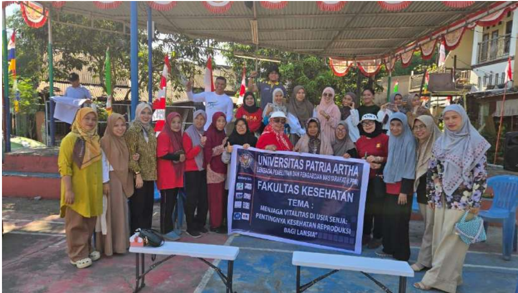
Gambar 2.1 Kegiatan PKM di Sekolah Lansia Abdie Harapan Sudiang Makassar

Pelaksanaan kegiatan pengabdian masyarakat ini mempunyai target yang akan dicapai yaitu memberikan informasi berupa edukasi dan penyuluhan kesehatan terkait pemahaman tentang kesehatan reproduksi dan menjaga vitalitas di usia senja sehingga lansia mendapatkan kualitas hidup yang lebih baik di usia senja.