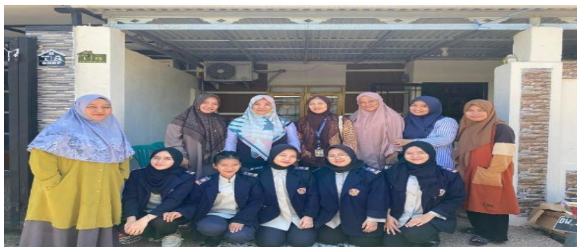
Gambar 2. Kegiatan Pengabdian