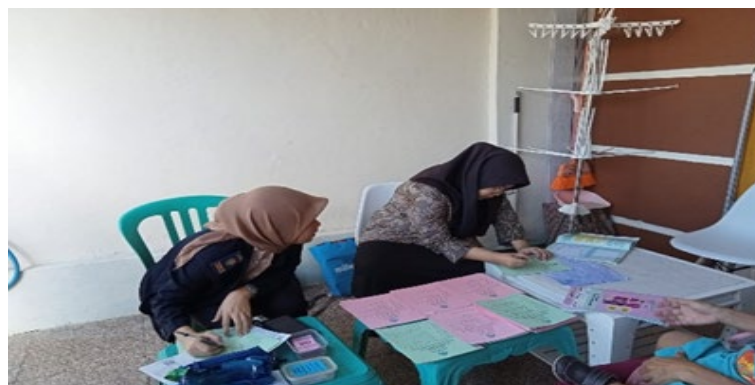
Gambar 1. Kegiatan Pengabdian