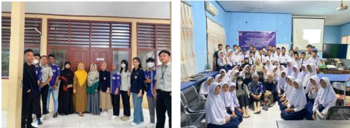
Gambar 1. Kegiatan Penyuluhan

Teknik pemberian games kepada siswa sangat efektif untuk membangkitkan semangat dan antusiasme siswa dalam mengikuti rangkaian acara hingga selesai. Ada banyak aspek pengetahuan terkait bahaya narkoba dan pergaulan bebas yang harus terus menerus disampaikan kepada siswa mengingat permasalahan peredaran narkoba ini sangat kompleks dan dapat mempengaruhi pergaulan remaja.