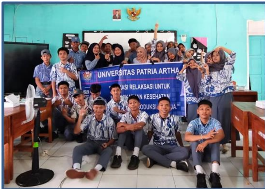
Gambar 4.2 Kegiatan PKM Edukasi Relaksasi di SMAN 13 Makassar