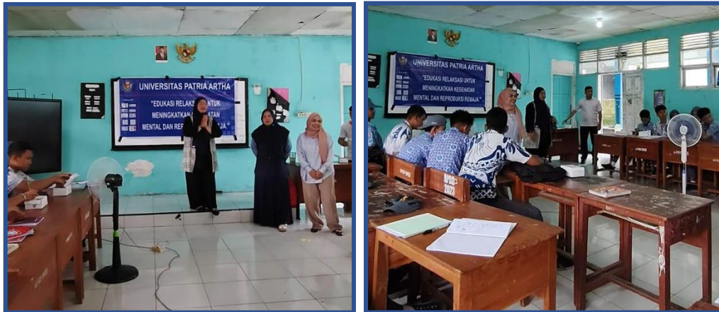
Gambar 2.1 Kegiatan PKM di SMAN 13 Makassar

Permasalahan utama yang diangkat dalam kegiatan pengabdian antara lain kurangnya pemahaman siswa mengenai kesehatan mental, kurangnya keterampilan siswa dalam mengelola stres dan kurangnya edukasi preventif terkait kesehatan reproduksi remaja.