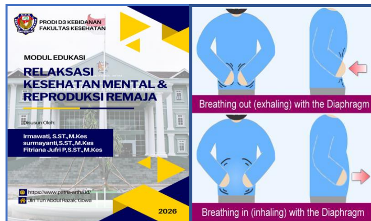
Gambar 4.1 Modul Edukasi Digital Relaksasi Kesehatan Mental dan Reproduksi Remaja

Selain itu, luaran dari kegiatan ini adalah tersusunnya modul edukasi relaksasi dalam bentuk digital yang dapat dimanfaatkan oleh pihak sekolah sebagai media pembelajaran berkelanjutan, khususnya dalam kegiatan Bimbingan Konseling (BK) dan Usaha Kesehatan Sekolah (UKS).