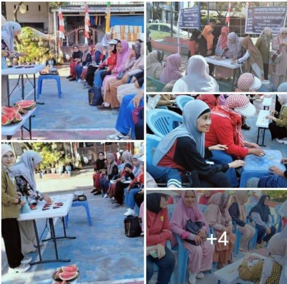
Gambar 4.3 Sosialisasi dan Demonstrasi pada Lansia di Sekolah Lansia Abdie Harapan Sudiang

Melihat antusiasme para lansia ada kegembiraan tersendiri yang kami rasakan sebagai tim edukator terhadap kegiatan yang kami lakukan ini, para lansia sangat senang dengan kegiatan tersebut apalagi sebagaimana yang kita ketahui bahwa dimasa lansia adanya penurunan fungsi motorik sehingga kegiatan ini dapat menstimulus fungsi gerak lansia dengan memberikan kegiatan atau skill yang dapat merangsang motorik dimana otot – otot tangan yang biasanya kaku secara berangsur bila kembali baik, selain menstimulus fungsi motorik lansia kegiatan ini dapat juga menstimulus fungsi kognitif lansia dengan menumbuhkan kreatifitas dan melatih fokus pada lansia sehingga efek jangka panjangnya mengurangi demensia dan Salah satu cara untuk mengurangi depresi yaitu dengan terapi sosial dengan kerajinan tangan. Kerajinan tangan merupakan cara yang tepat untuk bersenang – senang dan bersosialisasi dengan orang lain tetapi juga sangat bermanfaat pada kesehatan salah satunya dapat mengurangi kemungkinan gangguan kognitif , selain itu aktivitas yang berhubungan dengan ketajinan tangan memiliki efek positif pada kesejahteraan mental dan fisik pada lansia.