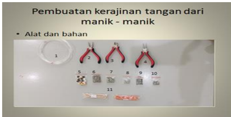
Gambar 4.1 Alat dan Bahan pembuatan gelang manik - manik