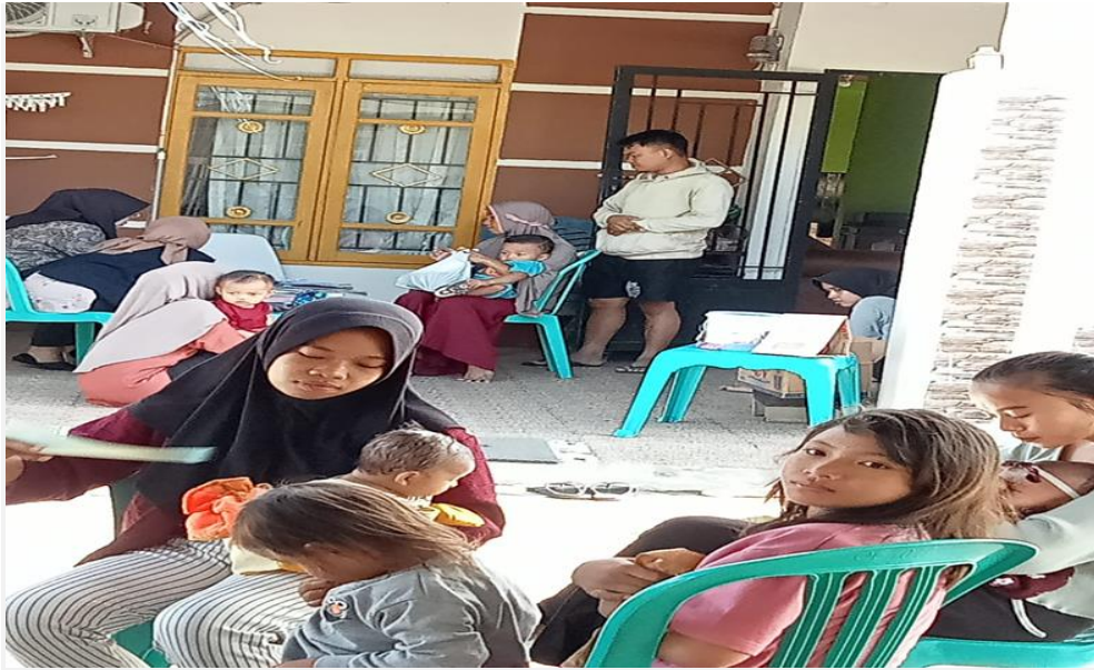
Gambar 2.1 Kegiatan Posyandu