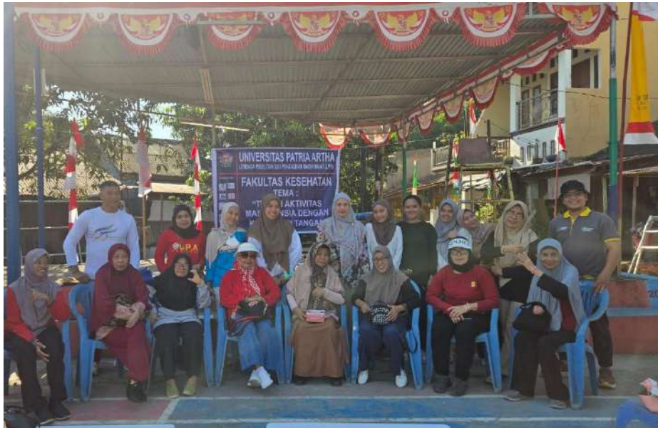
Gambar 2.1 Kegiatn PkM di Sekolah Lansia Abdie Harapan Sudiang Makassar

Pelaksanaan kegiatan pengabdian masyarakat ini mempunyai target yang akan dicapai yaitu memberikan pemahaman tentang kegiatan pada lansia sehingga ke depan mereka dapat menjadi lansia yang aktif dan produktif.