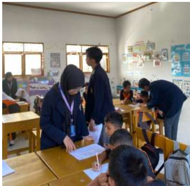
Gambar 3.1 Proses Kegiatan Penyuluhan

Kegiatan pengabdian kepada masyarakat ini dilakukan bekerja sama dengan Mahasiswa Fakultas Kesehatan Prodi S1 Kesehatan Masyarakat. Kegiatan ini dilakukan di SD Negeri 29 Banyuanyara Kecamatan Sanrobone Kabupaten Takalar, selama 1 (hari) pada tanggal 19 Agustus 2025. Metode yang dilakukan pada kegiatan pengabdian kepada masyarakat adalah memberikan pertanyaan terbuka tentang gizi seimbang dan makanan sehat sebelum dilakukan penyuluhan yang disampaikan oleh Mahasiswa dari UPA Prodi Kesehatan Masyarakat.