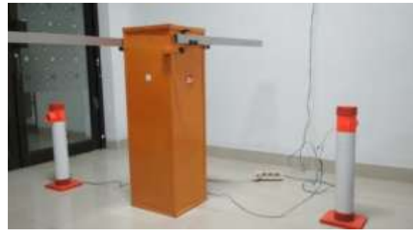
Gambar 3. Palang Parkir

Pengujian dilakukan secara terpisah dimasing-masing blok, setelah itu pengujian dilakukan secara keseluruhan. Adapun pengujian yang dilakukan yaitu pengujian terhadap hardware maupun pengujian software.