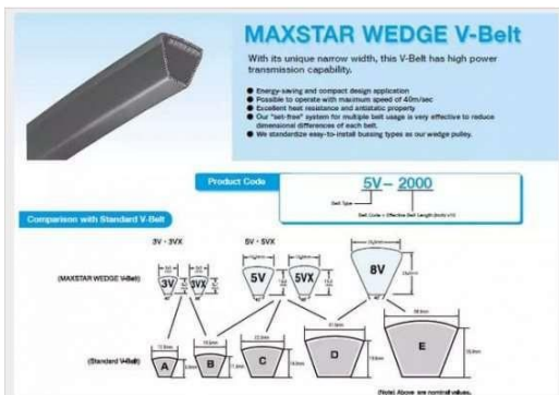
Gambar 4 Wedge Belt

Wedge Belt berfungsi untuk Industrial. Ukuran Wedge Belt setara dengan standard belt. perbedaan yang signifikan untuk Wedge Belt adalah bahan dan kelenturan dari belt itu sendiri yang memang di desain untuk Heavy Duty / Pekerjaan dengan beban tinggi. Type belt ini ditandai dengan simbol 3V, 5V, & 8V.