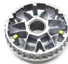
Gambar 2 Pulley

Pulley adalah suatu elemen mesin yang berfungsi sebagai komponen atau penghubung putaran yang diterima dari kendaraan motor kemudian diteruskan dengan menggunakan sabuk atau belt ke benda yang ingin digerakkan.