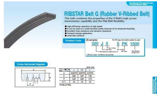
Gambar 6 Multi Rib Belt