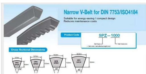
Gambar 5 Narrow Belt

type ini hampir sejenis dengan Wedge Belt. jadi bisa digunakan sebagai pengganti Wedge Belt. Type ini ditandai dengan symbol SPA, SPB, SPC, SPZ.