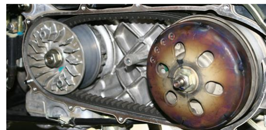
Gambar 7 V-belt dan Pulley Vario 110