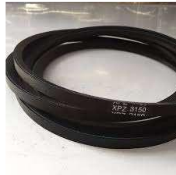
Gambar 1 V-belt

Tegangan belt terhadap pulley, Sudut kontak antara belt dan pulley)